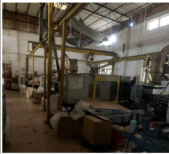
注塑车间内及窗户