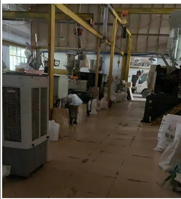
注塑车间南面及出入口