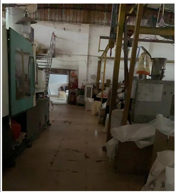
注塑车间北面及出入口