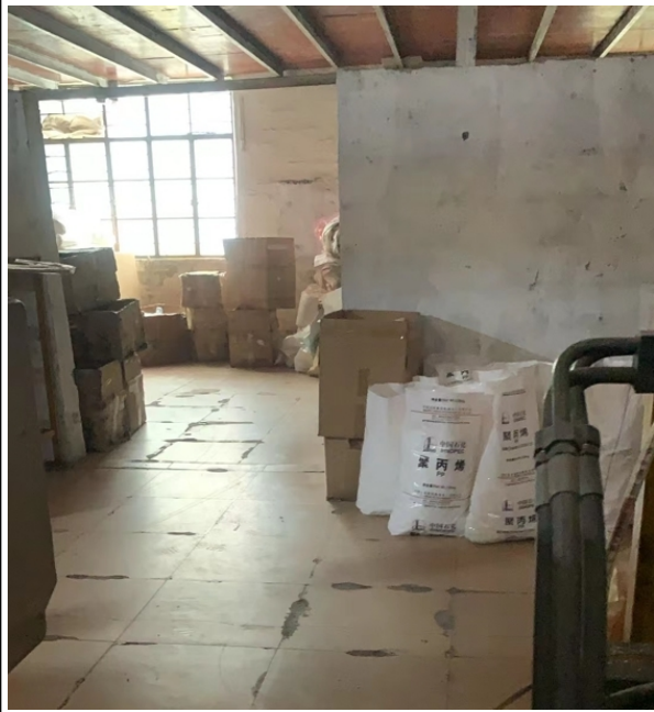
注塑车间西面出入口、破碎区