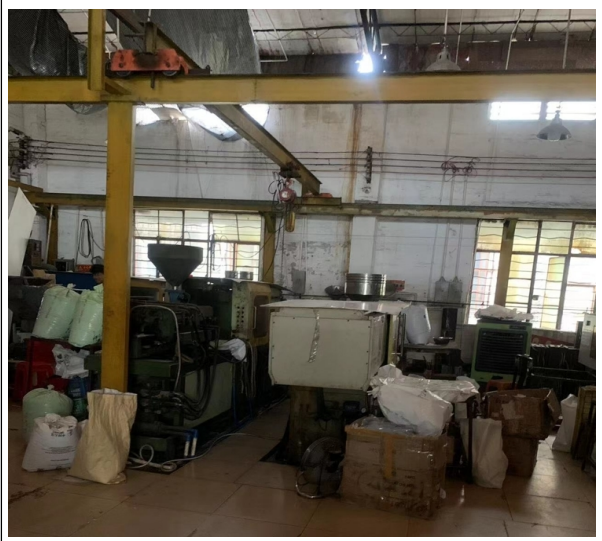
注塑车间内及窗户