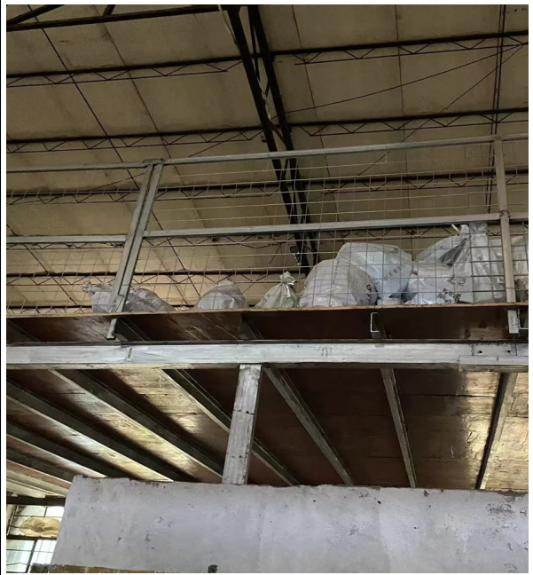
注塑车间西面破碎区上方夹层仓储