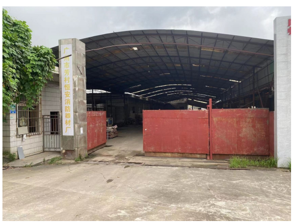
东南面消防器材厂