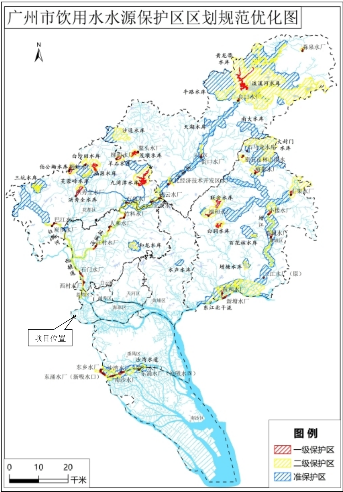
附图6 项目所在区域饮用水源保护区划图