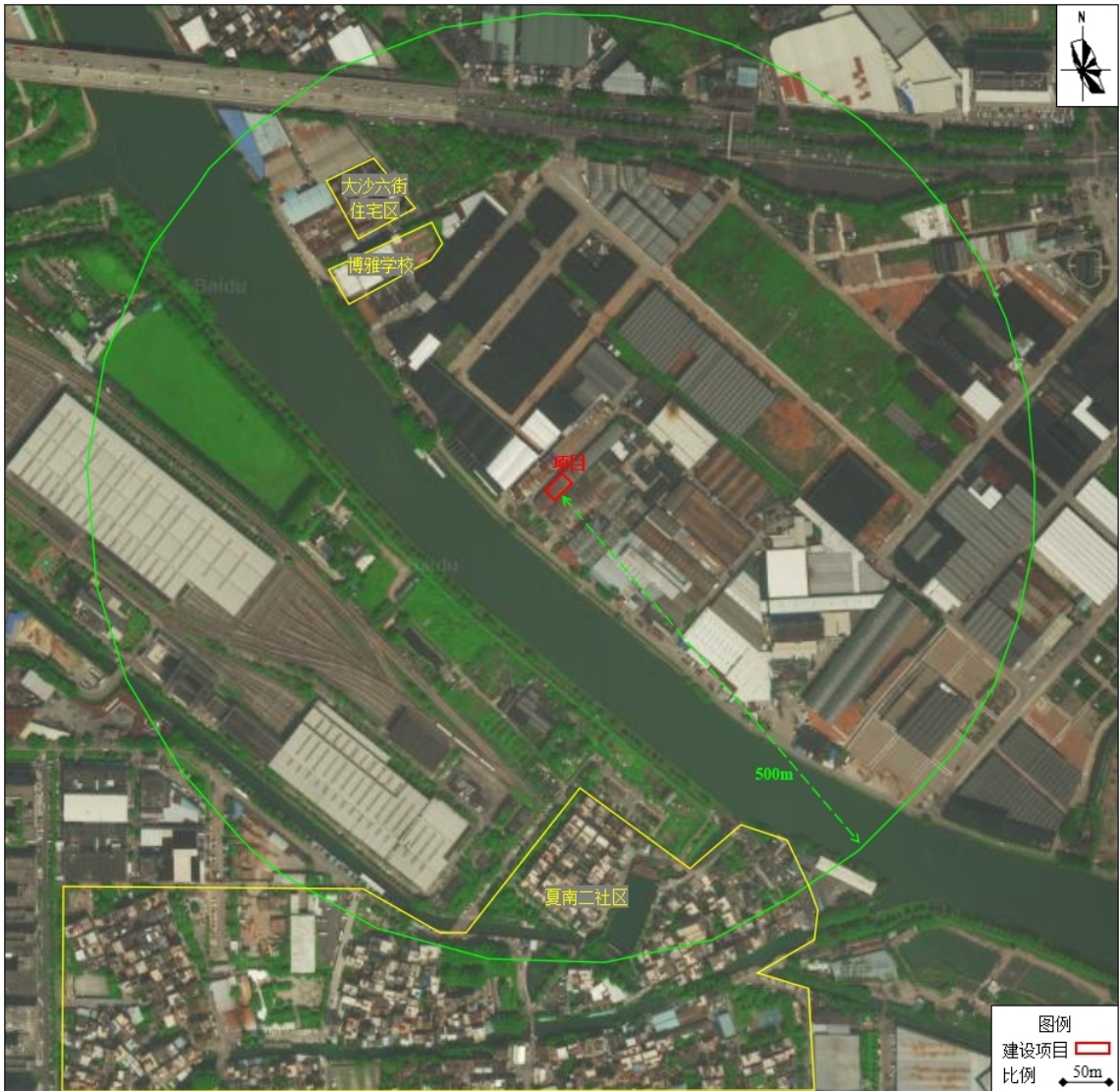
附图 9 项目周边环境敏感目标分布图