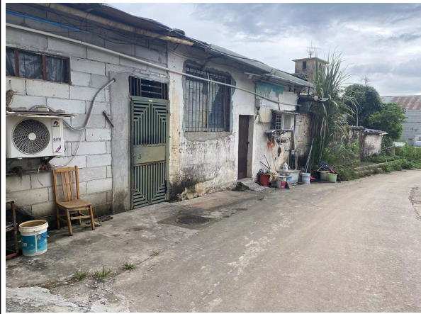
西南面消防器材厂宿舍